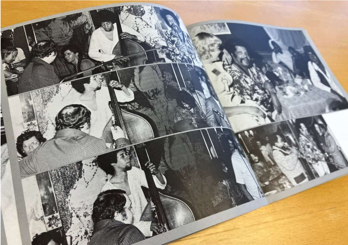
Kuva 1. Pori Jazz 1966–1974 -historiikin kuvitusta. Cannonball Adderleyn, Joe Farrellin, Chick Corean ja Stanley Clarken jमित ravintola Teljänhovissa vuonna 1972 ovat kertautuneet Pori Jazzin julkisessa muistamisessa.