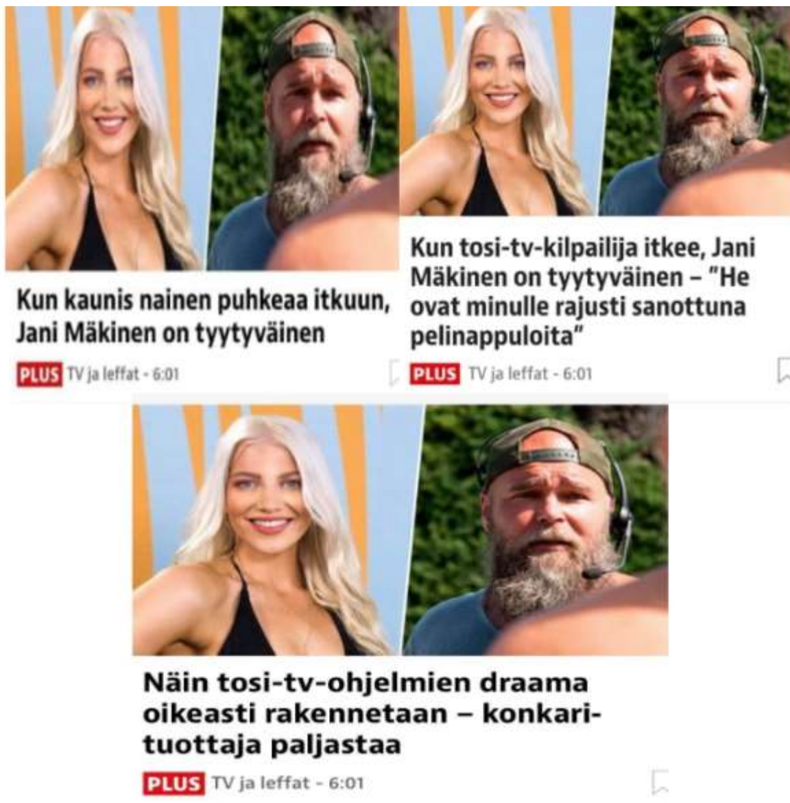
Kuva 7. Kuvasarja osoittaa, miten otsikko muuttui kolmeen otteeseen aamupäivän aikana, vaikka julkaisuaika pysyi kaikissa samana.

kuvaaja on tyytyväinen”, kuvaajan kokiessa osallistujan itselleen pelinappulaksi. Otsikkoa muutettiin vielä muutaman tunnin sisällä kertaalleen, jolloin se saatiinkin vastaamaan niin sanottua yleistä kuvaa: ”tuotannon edustaja kertoo, mitä kulisseissa oikeasti tapahtuu”. Tapahtunut kuvaa tarvetta saada kuluttajan huomio, mutta samalla tiedostaen olemassa olevan rajan, jolloin provokatiivisuus kääntyy jo itseään vastaan. Seurasin tilannetta usean tunnin ajan, ja ellen olisi ottanut kuvakaappauksia tasaisin väliajoin, tätä muutosprosessia ei olisi pystynyt tässä yhteydessä todentamaan. Yhtä kaikki, tasapainottelu myyvän sisällön ja kuitenkin tietyn perustellun imagon välillä on selkeästi mediataloille paikoin hankalaa. (Ks. Kuva 7)