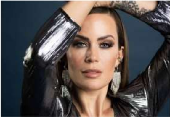
Martina Aitolehti on suomalainen televisioesiintyjä ja hyvinvointivalmentaja.

Martina Aitolehden tv-ohjelman julkistus aiheutti somessa värikästä keskustelua.