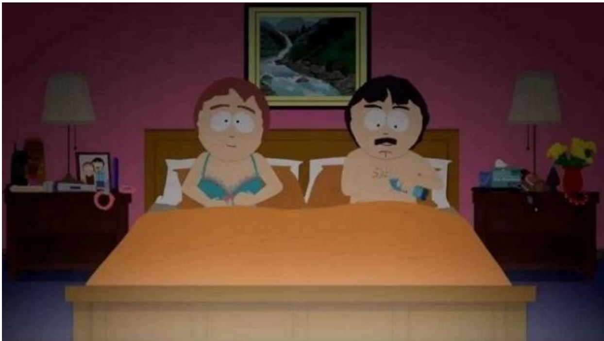
Kuva 18. South Parkin Randy ja Sharon varustautuvat informatiivisen murhapornon katselunautintoon ja siitä seuraavaan seksuaaliseen kanssakäymiseen.

Muun muassa Junko (2014) näkee erilaisissa sokkidokumenteissa yhtymäkohtia 1800-luvun friikkisirkuksiin, joissa vetonauloina toimivat pahasti epämuodostuneet tai ulkonäöltään muuten poikkeavat ihmiset (Asma 2009, 7; Junko 2015). Tiivistäen true crime -formaattien viehätys