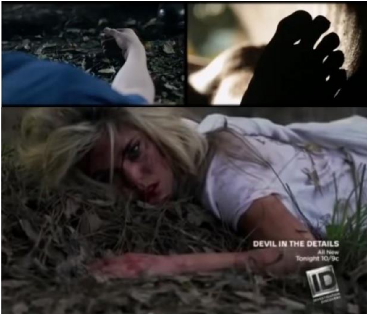
Kuva 13. Uhrin ruumis pyritään asemoimaan mahdollisimman realistisesti, mutta samaan aikaan puhuttelevasti ja tietyllä järkyttävyyden twistillä. Lähde: Murha porukalla , kausi 1, jaksot 5 (ylh.) ja Suomurhat , kausi 2, jaksot 8 (alh.).

Aivan kuten esimerkiksi elokuvien raiskauskohtauksissa myös true crime -formaateissa pyritään yleensä jäljittelemään realismia – tai pikemminkin yleistä konsensusta siitä, millainen on realistinen henkirikos. (ks. Nummela 2014, 24) (Kuva 13.)