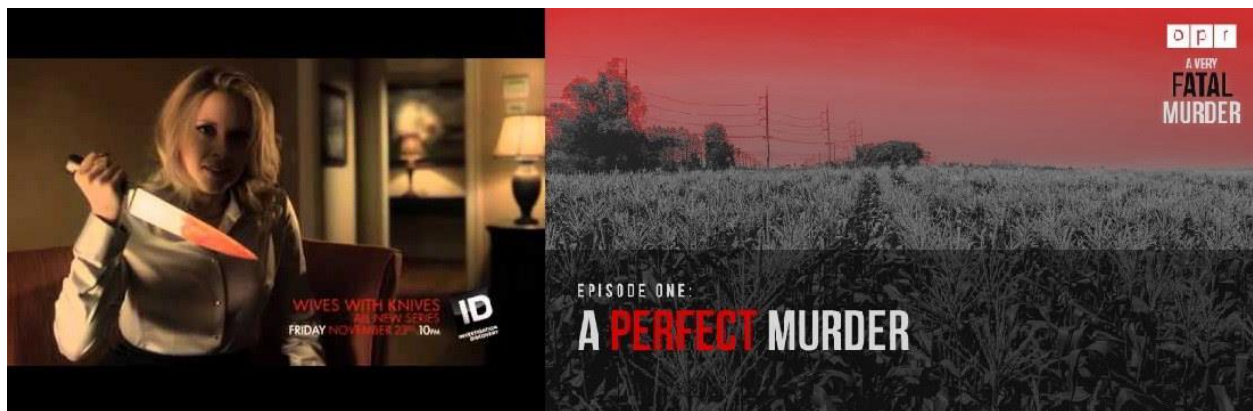
Kuva 4. Wives with Knives ja A Perfect Murder: A very fatal murder (tummennus kirjoittajan).

True crime -formaatit houkuttelevat katsojan mukaan jo formaatin otsikkotasolla (Kuva 4).