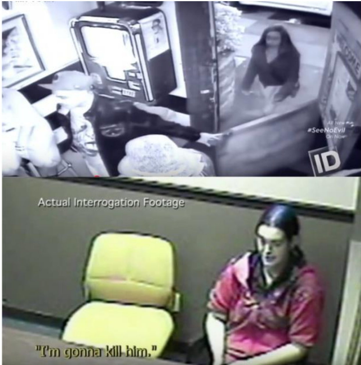
Kuva 9. Alla olevissa kuvissa käytetään autenttista tutkimusmateriaalia – niin valvontakamerakuvaa kuin kuulustelutilannetallennetta. Lähde: Kadonneet , kausi 3, jaksot 7 (ylh.) ja Murha porukalla , kausi 1, jaksot 5 (alh.).

Dokudraamalle tyypillisesti ohjelmissa esiintyy sekä näyteltyjä kohtauksia, rekonstruoituja tilanteita että aitoja tapahtumia. Osa pohjaa enemmän näyttelijöihin, toinen enemmän omaisten haastatteluihin ja asiatodisteisiin. Näytellyimmissä formaateissa esimerkiksi kuolinsyyn tutkijan haastattelut toteutetaan näytellysti ruumishuoneella (Kuva 10).