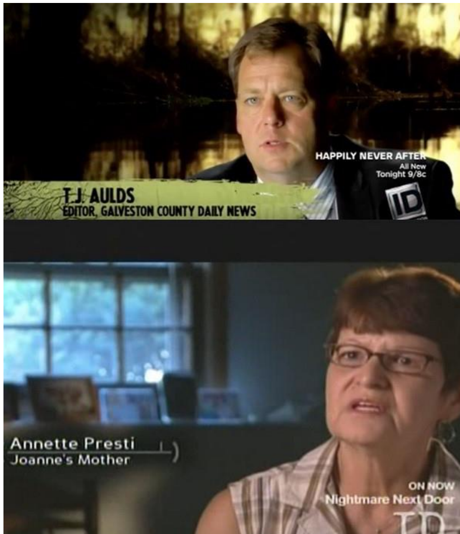
Kuva 6. Tapauksia käsitelleet etsivät sekä läheiset antavat haastatteluja yleensä juuri puolilähikuvassa.

Väliverrotonen 2009,194). Siksi tosi-TV:ssä tapahtumat esitetään usein yksilöiden kokemusten kautta (Hautakangas 2004, 10). Yksilön kokemuksen korostamisesta on löydettävissä tosi-TV-ilmion yhteen nivova, tärkein erilaisia formaatteja yhdistävä tekijä (Mononen 2007, 17). Hautakankaan (2014, 11–14) mukaan kyseessä on emotionaalinen realismi. Yleisesti nähdään, että dokumentaarinen kerronta rakennetaan usein ihmisten tarinoiden ympärille ja varaan (Saksala 2008, 117; Nichols 2010). Tämä toteutuu sekä asiantuntijoiden että uhrin läheisten haastatteluissa. Ilona Hongiston (2008, 9) mukaan dokumentaarisen todistamisen suunta muuttui 1970-luvulla yleiseltä tasolta yksityiselle ja toi samalla dokumentteihin tunnustuksellisuuden piirteitä. Tällöin niin sanotusta ”puhuva pää” -muodosta tuli korosteinen dokumenttien ilmaisukeino, jossa puhuva subjekti esitetään puolilähikuvassa tai kasvölähikuvassa antamassa todistustaan käsiteltävästä aiheesta (ks. myös Kuva 6).