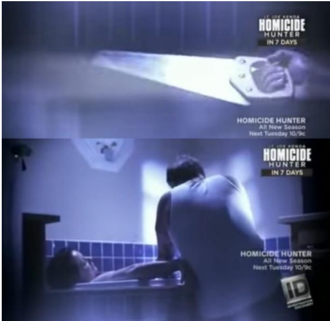
Kuva 16. Off-screen-väkivallalla katsoja pakotetaan avuttoman sivustaseuraajan rooliin.