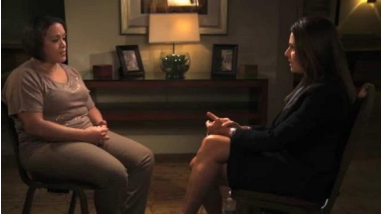
Kuva 1. Aphrodite Jones[5] haastattelee haastateltavaa kodinomaisessa ympäristössä.