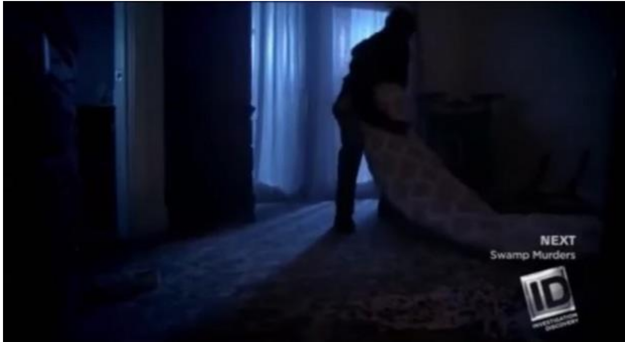
Kuva 2. Jaksoissa näytetään uhrin kuolemaan johtama tapahtumasarja, mutta usein myös, mitä sen jälkeen tapahtuu esimerkiksi ruumiin hävityksen osalta.

luultiin. Lopuksi katsojalle näytetään – tekijän ollessa jo tiedossa – miten päivä uhrin osalta rakentui ja miten se päättyi eli miten henkirikos toteutettiin. Kunkin jakson kliimaksina pystytään näyttämään rekonstruoimalla ja näyttelemällä uhrin kuolema ja usein myös ruumiin hävitys (ks. Kuva 2).