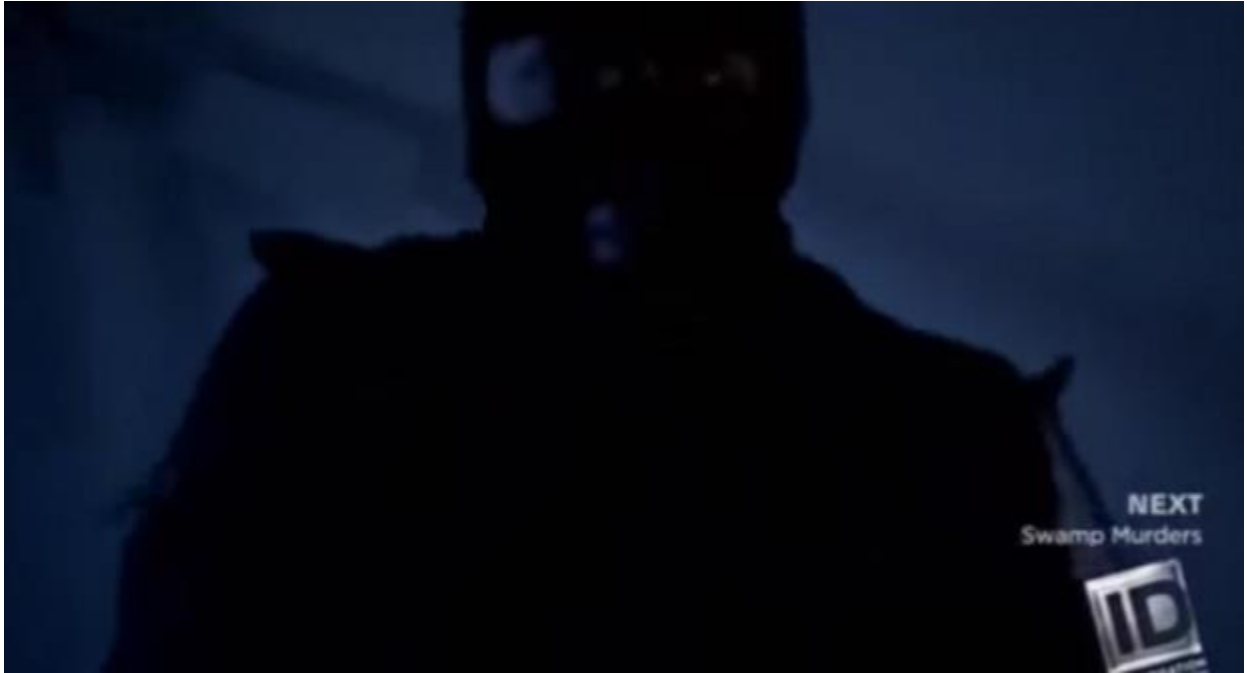
Kuva 14. Murhaaja on hiipinyt nukkuvan uhrin päälle, ja tämä on näkymä, kun hän avaa silmänsä.

Kohtausten kuvakulmat, kamerasijoittelu ja leikkaus ovat useimmiten toteutettu palvelemaan kerronnallisesti joko uhrin subjektiivista näkökulmaa, tai neutraalia sivustaseuraajan todistusta (Nummela 2014, 24.) Vastaavia keinoja käytetään myös true crime-formaateissa. Itse kuolemat näytetään usein ns. karpäsenä katossa- näkökulmasta, joskus kuolema esimerkiksi puukotus kuvataan uhrin silmin. Iso osa ohjelmista seuraa murhaajaa ja tilanteen eskaloitumista henkirikokseksi. Tämä kuvastaa uhrin haavoittuvuutta sekä murhaajan saalistamista. Aiemmin mainittua henkilökeskeisyyttä dokumenttien kuvauksessa dominoivat lähikuvat ja etenkin lähikuvat kasvoista (Junko 2014, 19.) True crime -formaateissa lähikuvat uhrien kasvoista (Kuva 15) ovat tärkeässä roolissa ja ne kutsuvat tuntemaan empatiaa, todistamaan uhrin tuskaa (Hoffman 2009; Kobach & Weaver 2012.)