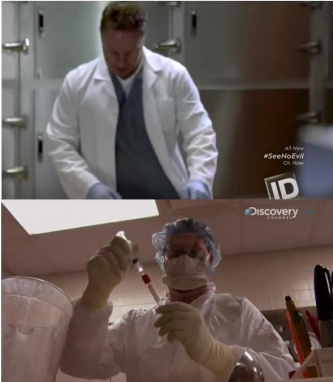
Kuva 10. True crime-formaateissa ruumiit tutkitaan näytellysti ruumishuoneella ja laboratoriotutkimukset laboratoriossa.

Oikeita, tapauskohtaisia asiantuntijoita – esimerkiksi rikostutkijoita – haastatellaan aina asiaan kuuluvat puvut päällä, jolloin korostuu, että kyseessä on uskottava henkilön näkemys ja kokemus (Kuva 11).