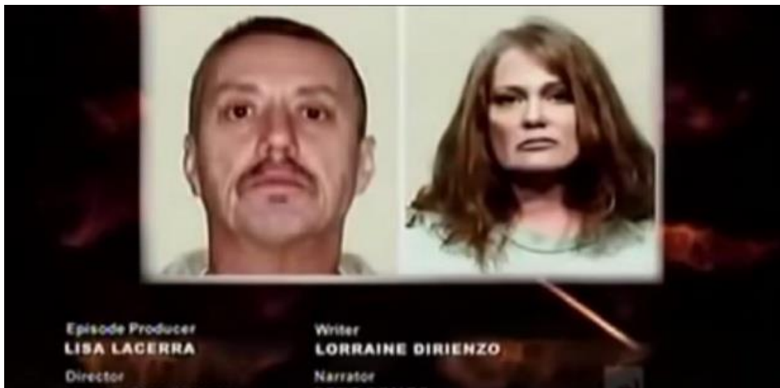
Kuva 3. Ohjelman lopussa katsojalle usein näytetään, miltä murhaajat oikeasti näyttävät.

Viimeisenä huippuna eli häivytyksenä näytetään usein murhaajan oikeudenkäynti ja myös oikea pidätyskuva (näyttelijät on valikoitu vastaamaan oikeaa ulkonäköä) hänen joutuessaan vankilaan (Kuva 3).