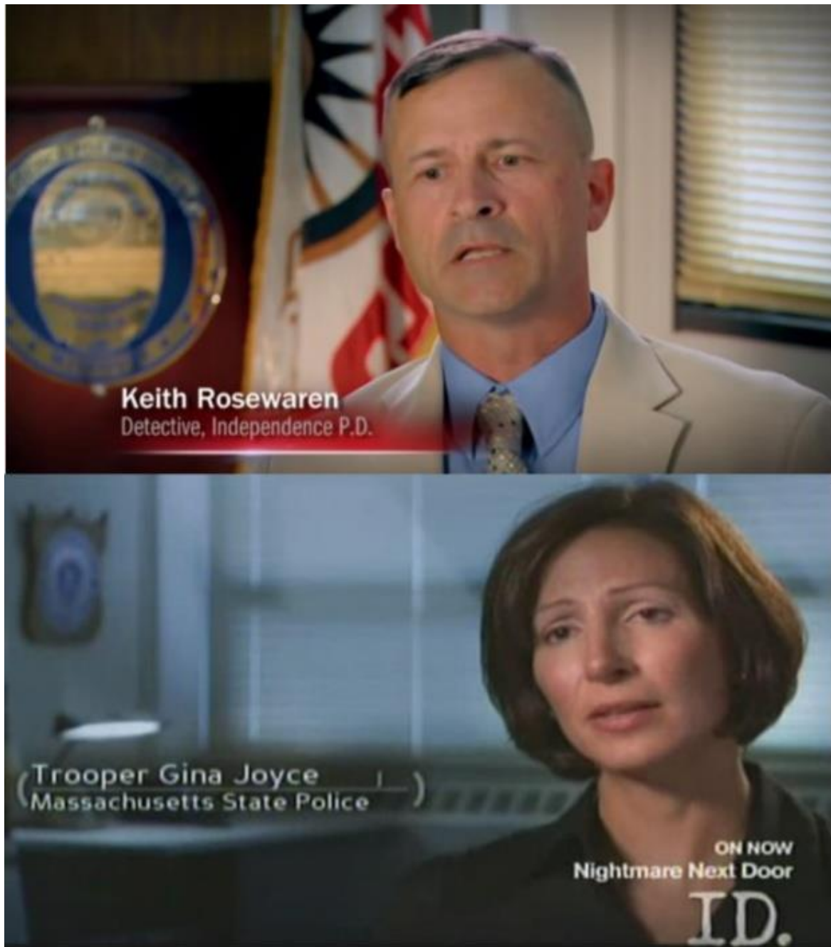
Kuva 11. Poliisivoimien erilaiset symbolit (esim. liput ja tunnukset) esitetään huomiota herättävällä tavalla seinällä haastateltavien takana. Ne ovat siellä vakuuttamassa haastateltavien aitoudesta. Lähde: Tappavat suhteet , kausi 1, jakso 10 (ylh.) ja Painajainen naapurissa , kausi 4, jakso 8 (alh.).

Rikospaikkatutkinta sekä etsivien aivoriihi pyritään myös rakentamaan niin realistiseksi kuin televisio/elokuvamaailman konventioita (esim. C.S.I. ) noudattaviksi (Kuva 12). Tämä on se visuaalinen tapa, johon katsojat ovat fiktiivisten rikossarjojen osalta jo tottuneet.