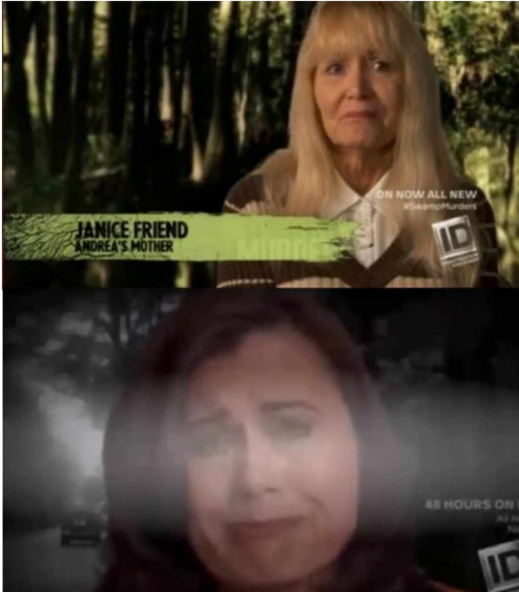
Kuva 7. Itkuisia ja tunteikkaita läheisten haastatteluja löytyy lähes jokaisesta formaatista.

Koska tapaukset ovat aina järkyttäviä, ei ole yllättävää, että true crime -formaateissa uhrien läheiset kertovat itkuisina ja yleisesti tunteiden vallassa kokemuksiaan (Kuva 7). Jos taas uhri on jäänyt henkiin, hän kertoo karmaisevasta kohtalostaan katsojalle näissä haastatteluosuuksissa.