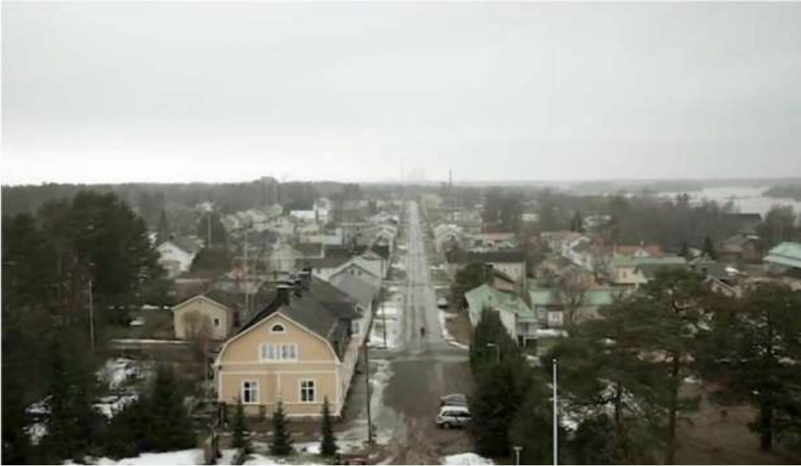
Kuva 9. Drooni-kuvissa Reposaaressa tunnistettava keskusta ja pääkatu nähdään elokuvan alussa ja lopussa. Draaman kaari yhdistyy, kun Rauni häviää loppukuvissa osaksi kylän miljöötä.