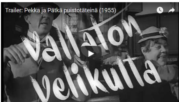
Video 1. Pekka ja Pätkä puistotäteinä -elokuvan (1955) ennakkomainos.

Suomalaisten perhe-elokuvien edeltäjiä olivat vuosina 1941–1945 valmistuneet kuusi Suomisen perhe -elokuva. Puupää-elokuvien valmistumisen aikaan oli puute lastenelokuvista ja nimenomaan sellaisista, jotka itse löytävät tiensä lasten suosioon. Puupää-elokuvien juonirakenteet ja kielellinen huumori oli tarkoitettu lähinnä aikuisyleisölle, päähenkilöiden olemus ja kommellukset puolestaan viehättivät lapsiyleisöä (Varho 1996, 183; Koivunen ym. 1997, 105; Marjamäki 2007, 291). Vaikka Puupää-elokuvia on pidetty lastenelokuvina, niitä katsoivat – ja edelleen katsovat – sekä aikuiset että lapset. Lohikosken (1993, 206) mukaan elokuvien tavoitteena ei ollut korkeakulttuuri eikä ylenpalttinen kasvatuksellisuus, vaan Puupää-elokuvien tekijöiden motiivina oli halu viihdyttää, saada nuoret ja vanhemmat nauramaan yhdessä arjen keskellä. Elokuvan Pekka ja Pätkä puistotäteinä ennakkomainos (Video 1) lupaaakin jokaiselle jotakin: huumoria, nokkelia käänteitä, naurupaukkuja, rakkautta, suosikkinäyttelijöitä ja uusia kasvoja, riemukkaita tilanteita, toisista huolehtimista, byrokratian ohitusta, yllätyskäänteitä.