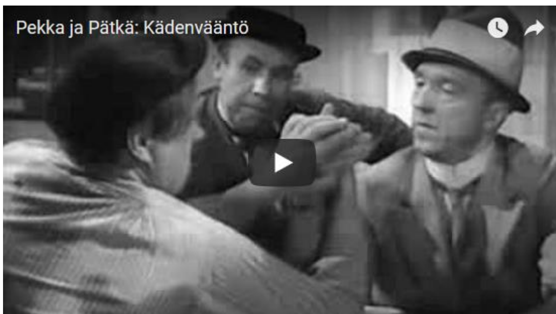
Video 4. Sananlaskuja tai sananlaskumaisia ilmauksia elokuvasta Pekka ja Pätkä mestarimaalareina .

Tarkasteltava elokuva-aineisto koostuu noin 250 sananlaskusta. Enemmän kuin kolmannes käytetyistä sananlaskuista esiintyy kolmessa elokuvassa: Pekka Puupää ; Pekka ja Pätkä miljonääreinä sekä Pekka ja Pätkä mestarimaalareina . Elokuvan Pekka ja Pätkä mestarimaalareina vajaan seitsemän minuutin näytteessä kuullaan seitsemän sananlaskua, sananlaskuksi nimettyä ilmausta tai viittausta sananlaskuun. [5] Viimeisessä elokuvassa Pekka ja Pätkä neekereinä sananlaskuja on huomattavasti muita elokuvia vähemmän. Selitys voi olla siinä, että vaikka elokuva pyrki jatkamaan edeltäjiensä kaltaisena niin sekä ohjaajan että käsikirjoittajan vaihdos näkyy käytetyssä kielessä.