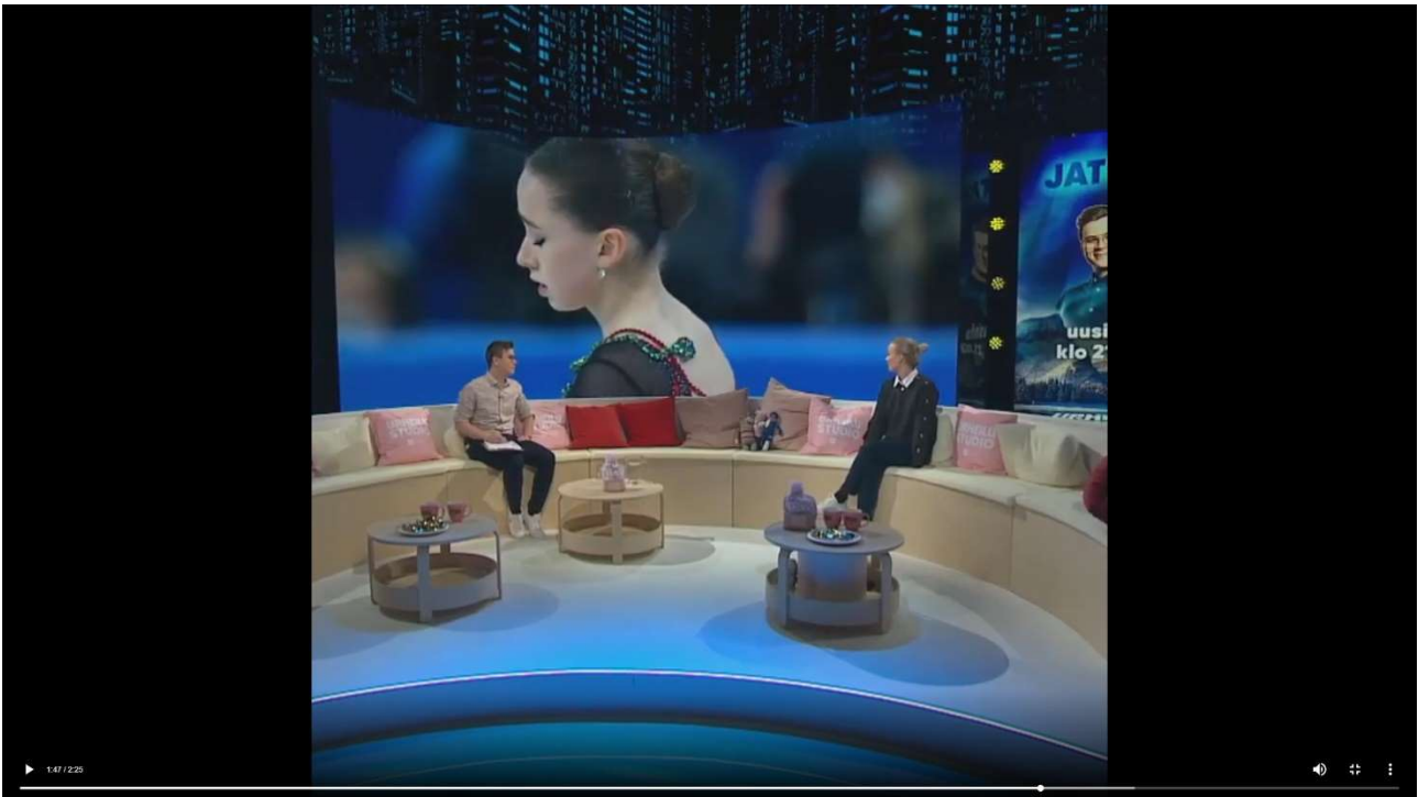
Video 2. Kiira Korpi kommentoi Valijevan tapausta Yle Urheilun olympialähetyksessä.