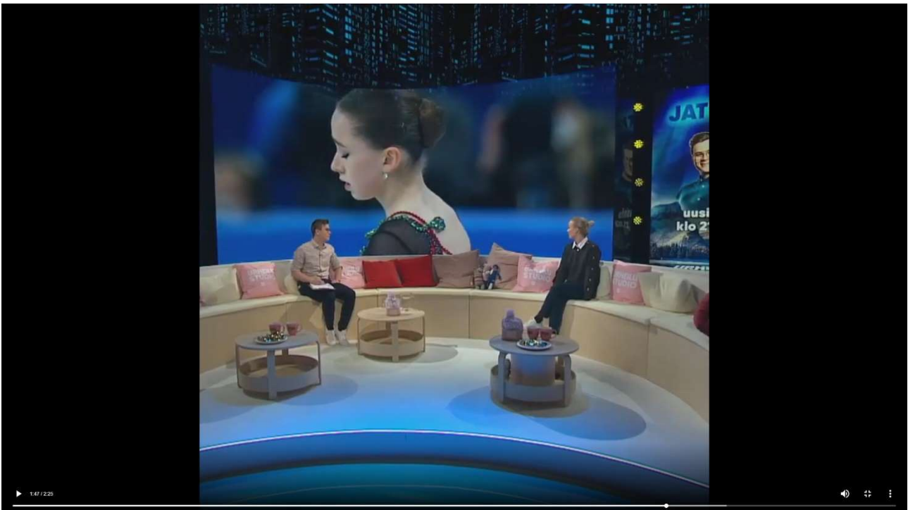
Video 2. Kiira Korpi kommentoi Valijevan tapausta Yle Urheilun olympialähetyksessä.

Mielipiteiden ilmaiseminen ja oman lajin kritisoiminen on tänäkin päivänä helpompaa entiselle urheilijalle, minkä lisäksi urheiluyhteisö on nykypäivänä vastaanottavaisempaa kuin ennen. Kiira Korven tapa käyttää asiantuntija-asemaansa ja osakseen saamaansa mediahuomiota Pekingin talviolympialaisten aikana lajikulttuurin muutosvaatimusten esiintuomiseen on joka tapauksessa hyvä esimerkki nykypäivän urheiluaktivismista, jolla pyritään vaikuttamaan vallitseviin olosuhteisiin ja korjaamaan urheilukulttuurin epäkohtia.