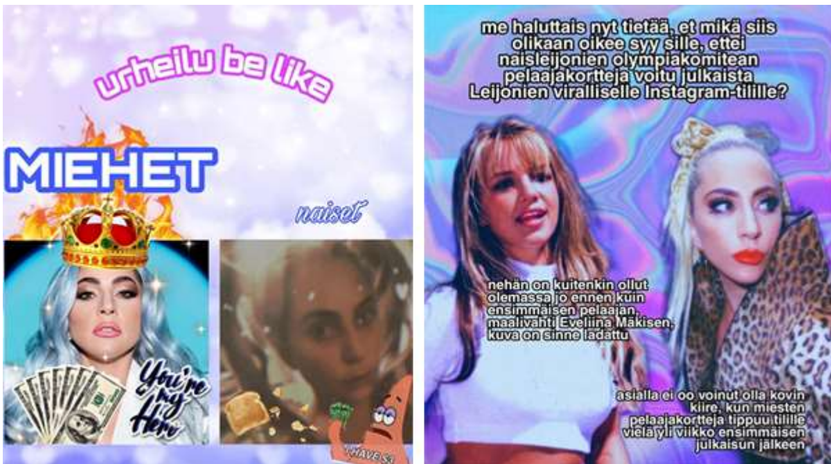
Kuva 2. Kuvakohusta tehdyt meemit @lemmenkipee:n Instagram-tilillä.

perusominaisuutena ja tehokeinona (Saarikoski 2016) ja kyseisellä meemillä otettiin huumorin avulla sarkastisesti kantaa Mies- ja Naisleijonien pelaajakorttien eriävään ulkonäköön. Käyttäjä @lemmenkipee myös kannusti kuvatekstissään ihmisiä ”tsekkaamaan” @leijonatfi-tilin ”kuvien erot naisten ja miesten Olympiajoukkueiden esittelyjen välillä”.