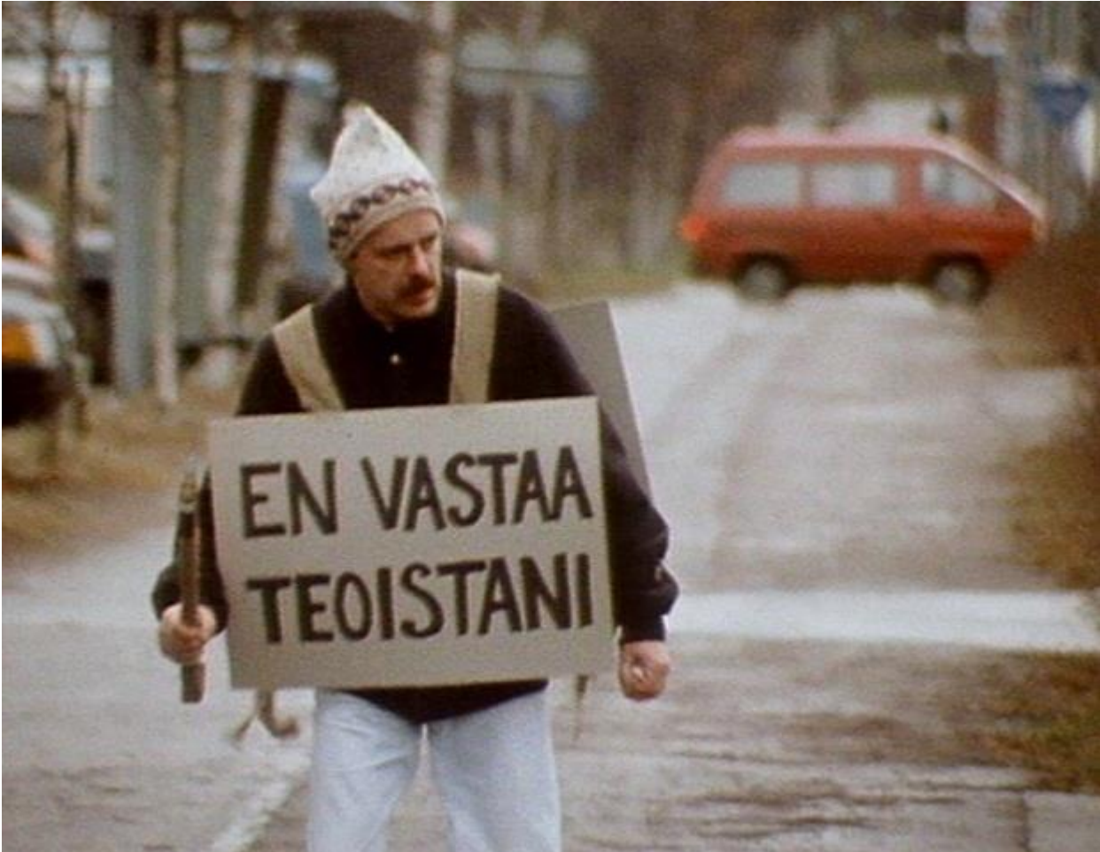
Kuva 5. Teollisuuslaitos Harjavallassa kieltäytyi vastaamasta päästöistään. Karpo sovelsi ajatusta inhimilliseen mittakaavaan Karpolla on asiaa -ohjelmassa vuonna 1988.

Dramatisoitujen osuukien jälkeen jutuissa seuraa yleensä analyttisempi osio, jossa aihetta käsitellään perinteisemmän journalismin keinoin, haastattelemalla aiheeseen osallisia ihmisiä sekä asiantuntijoita. Toinen Karpon viljelemä dramatisointien muoto ovat erilaiset piilokamera-tyyppiset koetilanteet, joissa seurataan, kuinka satunnaiset kansalaiset toimivat erilaisissa tilanteissa, joihin saattaa liittyä lavastettuja tappeluja, auto-onnettomuuksia tai muita vastaavia rakennettuja ärsykeitä.