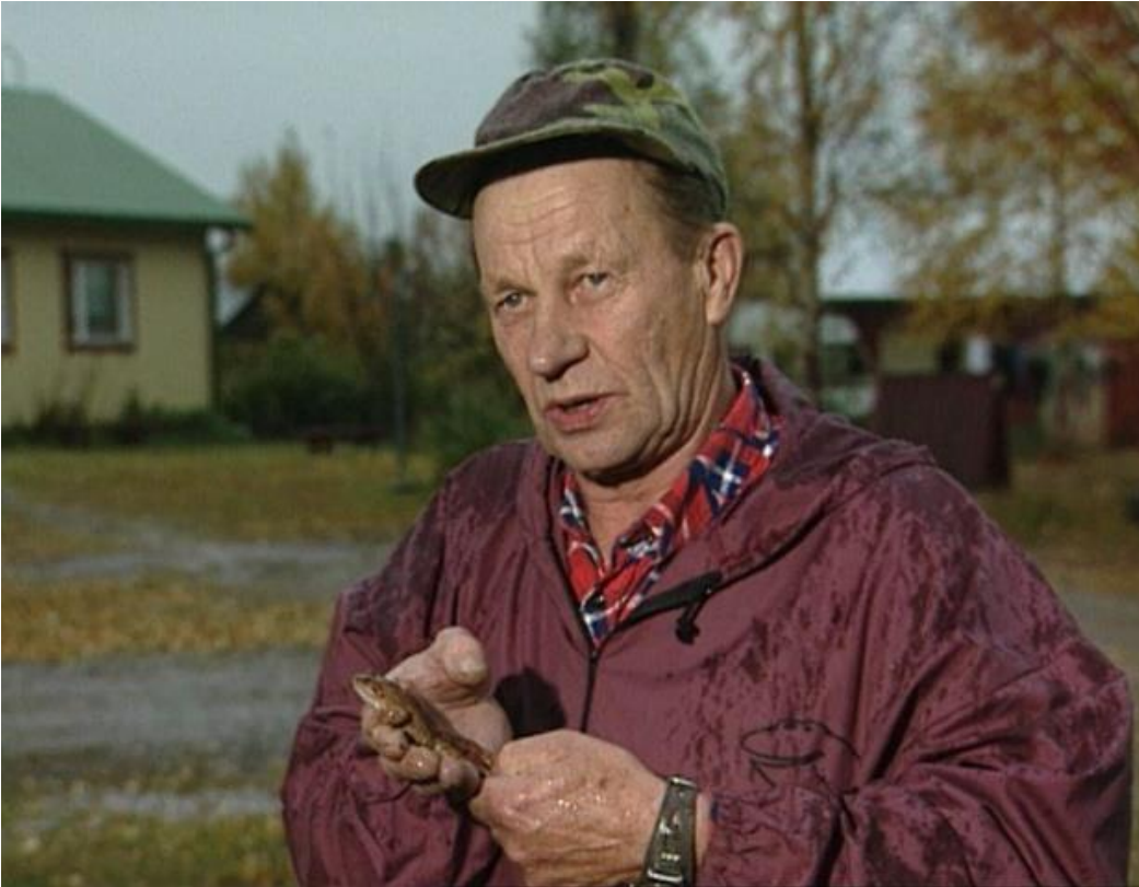
Kuva 3. Taisto Heikkinen tuli suomalaisille tutuksi Karpolla on asiaa -ohjelman säätä ennustavana sammakkoprofessorina. Kuva ensiesiintymisestä vuodelta 1995.