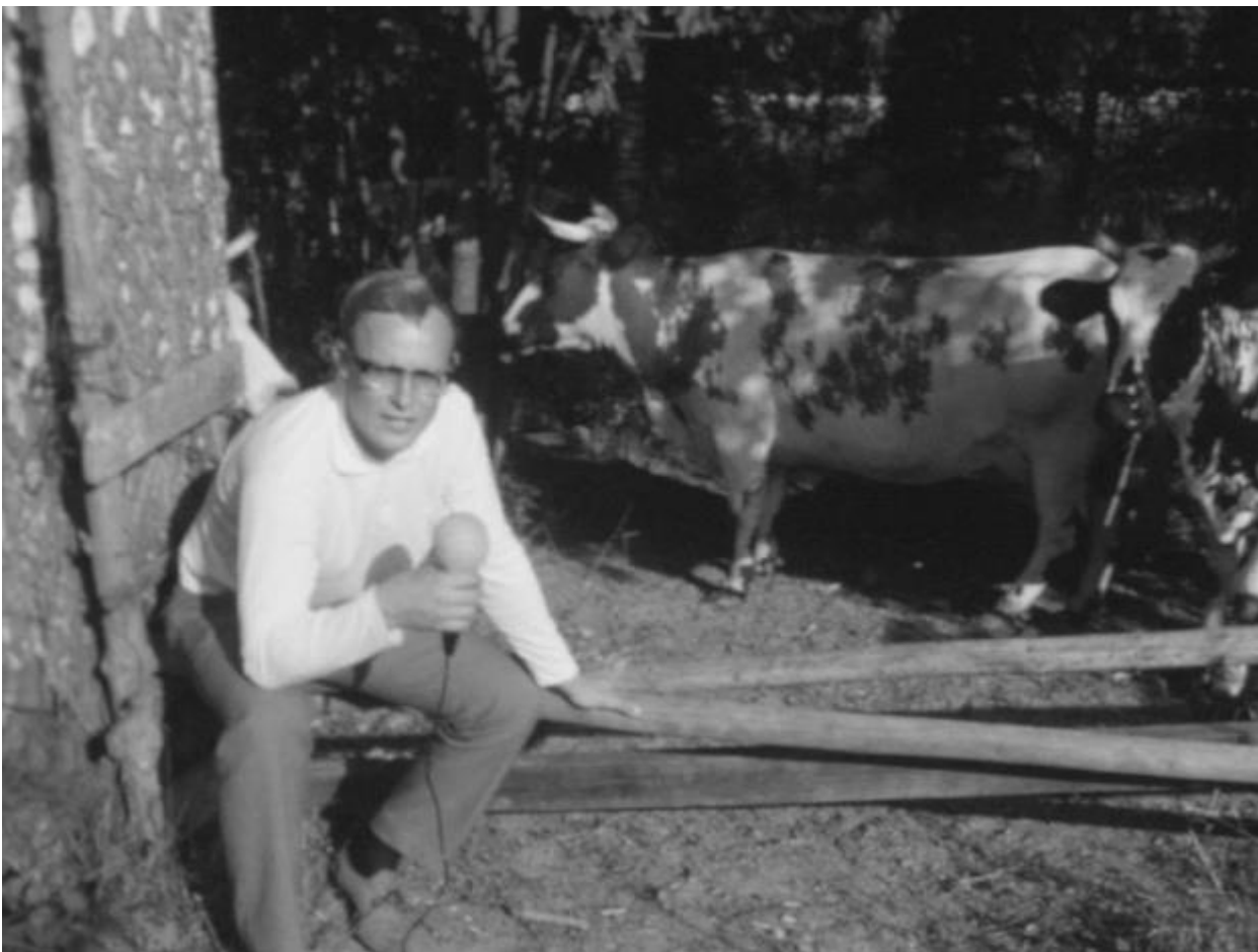
Kuva 1. Hannu Karpo toimittajana Yleisradion Myöhäisuutisissa 23.7.1966.

Lukuisia kompilaatioelokuvia tehnyt Peter von Bagh päätyy teoksessaan Peili jolla oli muisti käyttämään elokuvallisesta kollaasista kompilaatioelokuvan nimeä, vaikka pitää rajausta monitulkintaisena. Yksinkertaisimmin kompilaation voi määritellä poikkeavan tavanomaisesta elokuvakerronnasta siten, että se yhdistää jo olemassa olevia audiovisuaalisia tuotteita luodakseen niiden kautta uusia merkityksiä sisältävän audiovisuaalisen tuotteen (von Bagh 2002, 35–36). Tosikertomuksia havumetsien maasta tarjoaa katsojalle kompilaation keinoin käsityksen lähimenneisyydestä, sillä se sisältää paljon historialliseksi katsottavaa materiaalia. Lisäksi kooste tarjoaa katsojalleen katsauksen Hannu Karpon uraan ja hänen tapansa kuvata näkemäänsä todellisuutta. Koska kompilaatio on rakennettu ilman dramatisoivaa musiikkia tai selittävää ääniraitaa, jää ainoaksi käytettävissä olevaksi kerronnan keinoksi leikkaus. Se, millaista aineistoa kompilaatioelokuvaan on valittu ja miten nämä aineistot on yhdistetty suhteessa toisiinsa rakentaa katsojalle assosiaatioketjun, jonka lopputulemana on katsaus Suomeen Hannu Karpon silmin.