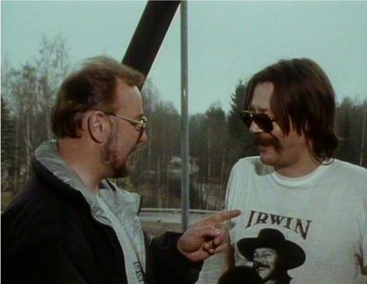
Kuva 2. Irwin Goodman muistelemassa menneitä Karpolla ei ole asiaa -vappuohjelmassa 1989.

Peter von Bagh käsittelee teoksessaan kompilaatioelokuvaa vuosina 1895–1970, joten moderni aika jää siinä kokonaan käsittelemättä. 2000-luvun pirstoutunut mediamaailma ja hajautuneet yleisöt tarjoavat ja tarvitsevat omanlaisensa tulkintakehyksen vanhaa kierrättävälle kompilaatioelokuvalle. Huomattava osa modernin audiovisuaalisen kulttuurin tuotteista rakentuu intermediaalisuudelle ja lajityypeillä leikittelylle. Nostalgia ja retro-kulttuuri perustuvat vanhan kuvaston kierrätykselle ja mediatuotteiden määrän lisääntyttyä on niiden helpompi keskustella suoraa toistensa kanssa, tosielämän kommentoinnin sijaan. Mari Pajala on analysoinut televisiolle tyypillisiä muistamisen muotoja ja televisiota muistiteknologiana. Hän kirjoittaa, että 1970-luvulta eteenpäin televisio on ollut mahdollista esittää osaksi amerikkalaista kulttuuriperintöä ja sille on luettavissa myös kulttuurihistorioitsijan rooli. Taustalla on ajatus mediasta tärkeänä historiallisen tiedon ja muistojen lähteenä. Näin televisio toimii myös kulttuurisen muistin rakennuskenttänä. (Pajala 2011, 164–168.) Populaarikulttuurissa käsitystä menneisyydestä neuvotellaan jatkuvasti uudelleen, jokaisen historian