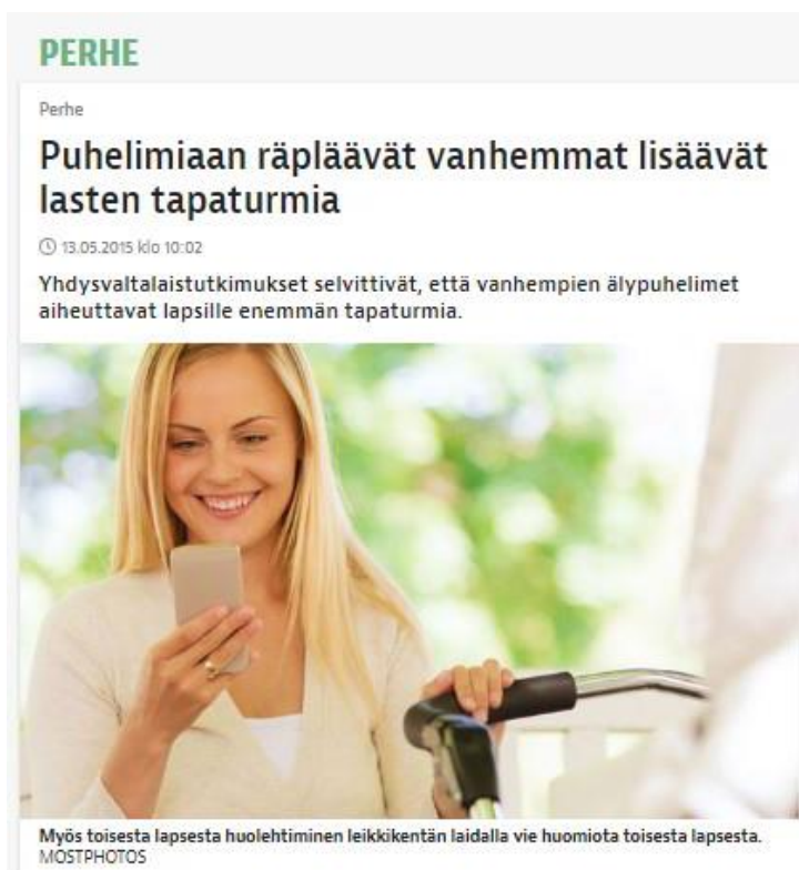
Kuva 1. Amerikkalaistutkimuksen mukaan vanhempien puhelimen käyttö lisää lasten tapaturmia.