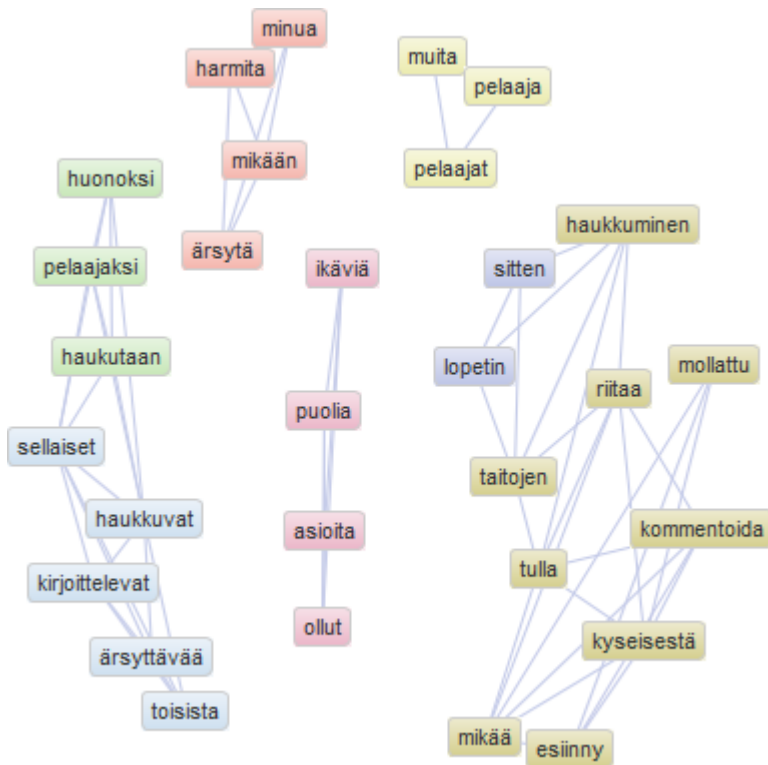
Kuvio 3. Kielteisiä kokemuksia kuvaavien avointen vastausten sanakartta.

Sanakartasta tai -pilvestä ei näy asia, joka aineistoa lukiessa on silmiinpistävää ja joka herättää kysymyksen myös pelaajan #19 vastauksen yhteydessä: kirjoittaja puhuu todennäköisesti ennemminkin oman joukkueensa pelaajasta kuin jostain vierasjoukkueesta, vaikka se ei vastauksesta suoraan ilmenekään. Noin puolessa tapauksissa ”mollaajat” ovat vierasjoukkueiden pelaajia, jotka haukkuvat hävinnyttä joukkuetta ja sen pelaajia, mutta lähes yhtä suuri osuus mollaamisesta näyttäisi tulevan omasta joukkueesta. Myös haukkumisen käänttöpuoli aiheuttaa joissain vastaajissa kielteisiä tunteita. Vastaus 23 on tämän osalta hyvin selkeä: