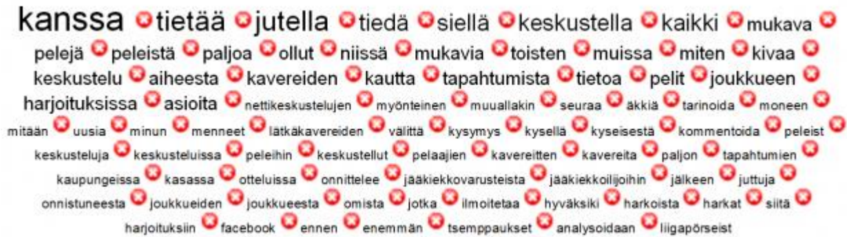
Kuvio 5: Myönteisiä kokemuksia kuvaavien avointen vastausten sanapilvi suuruusjärjestyksessä.

Sosiaalisen median suomat mahdollisuudet luoda ja ylläpitää kavereiden suhteita muihin harrastajiin tulevat myös hyvin näkyville: