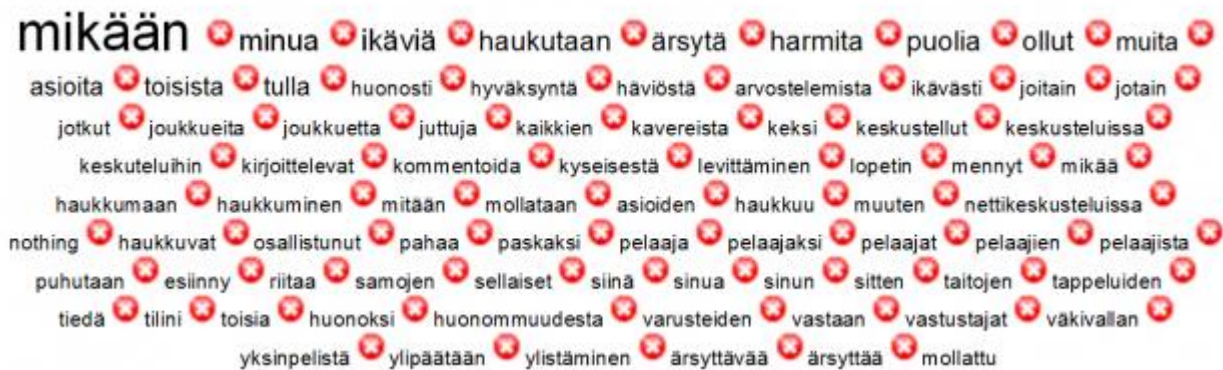
Kuvio 2. Kielteisiä kokemuksia kuvaavien avointen vastausten sanapilvi suuruusjärjestyksessä.

Ikäviin kokemuksiin liittyvien vastausten sanakartta ja -pilvi kertovat vastausten luonteesta paljon. Kuten sanapilvi (kuvio 2) osoittaa, merkittävä osa vastaajista (n=12) toteaa melko suorasanaisesti, ettei ikäviä kokemuksia olekaan. Sanakartasta (kuvio 3) näkyy asiayhteys. Kun vastaaja käyttää yleisintä ”mikään” sanaa, se tavallisimmin liittyy lauseisiin ”ei minua mikään harmita” tai ”ei minua mikään ärsytää”: