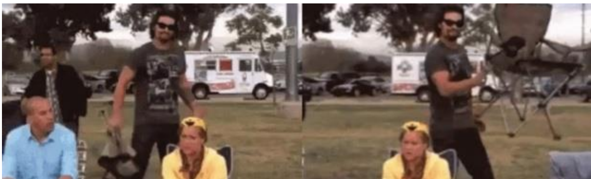
Kuva 3. Kuvakaappaus alkuperäisestä dramatic chair-gifistä.

Yhteisöllisyyden muodostumisen perusta on vuorovaikutuksen lisäksi yhteisön muodostama tuki. Aineiston vastauksista olen muodostanut melko selkeän johtopäätöksen siitä, että suurin Naistenhuoneella yhteisöllisyyden kokemusta vahvistava tekijä on avun pyytäminen ja avun tarjoaminen. Se saattaa olla konkreettista apua, verkon välityksellä tapahtuvaa tai esimerkiksi muin viestintäkeinoin helpotusta kaipaavan saama tuki. Yhteisöllisyyden kokemus on suurimmillaan, kun apua on itse saatu tai annettu, mutta se heijastuu myös sivusta seuraajiin