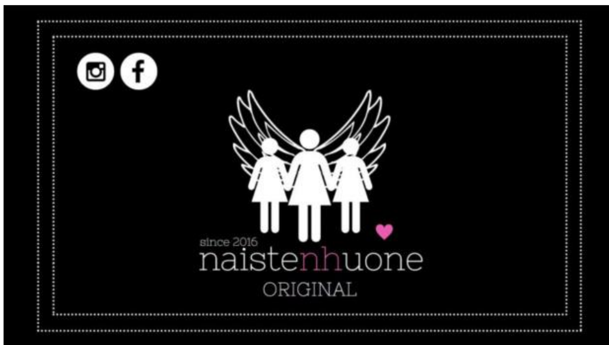
Kuva 1. Naistenhuone-ryhmästä on olemassa useita eri versioita ja siksi alkuperäinen Naistenhuone kuvataan otsikkokuvassa nimellä Naistenhuone Original.