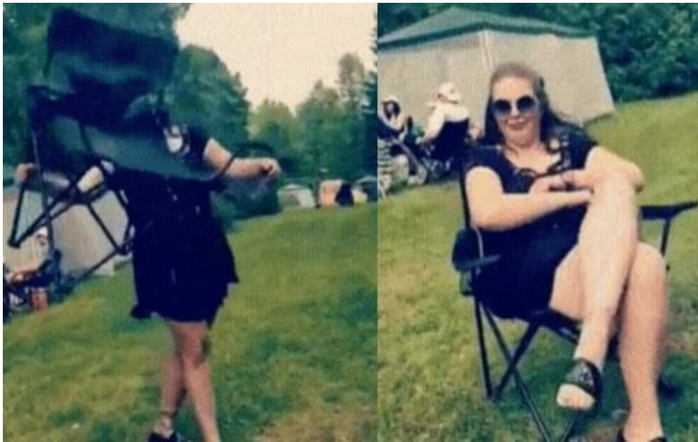
Kuva 2. Naistenhuoneen tekemä oma versio dramatic chair-gifistä.

käytetään verkkokeskustelufoorumeilla kuvaamaan sitä, että jäädään seuraamaan dramaattista keskustelua sivusta. Naistenhuoneen version gif-animaatio on kuvattu jäljennös alkuperäisestä, jossa nainen avaa kokoontaitettavan retkituolin dramaattiseen tyyliin ja istuu siihen. Tätä käytettiin hyvin usein keskusteluissa, jotka kyselylomakkeiden vastaajienkin mukaan usein ”äityivät kiivaiksi.”