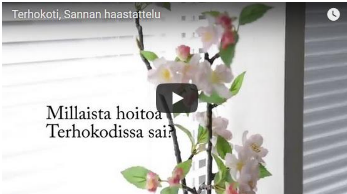
Video 3. Terhokodin saattohoitopotilaan puolison haastattelu. Linkki: https://youtu.be/LN0JcP8F2Hs .