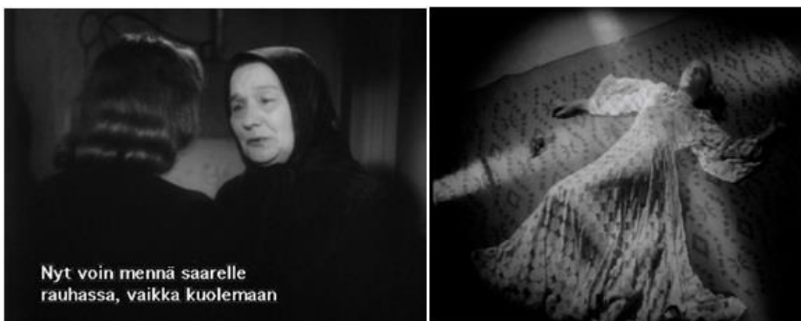
Kuva 5. Kuoleman tematiikkaa käsittelyä Teuvo Tulion tuotannossa. Kuvakaappaukset elokuvista Sellaisena kuin sinä minut halusit (vasen) ja Rakkauden risti (oikea).

mielisairaaksi ja aiheuttaa suurta surua, josta täydellinen toipuminen ei välttämättä koskaan tapahdu. Rakkauden ristissä tyttärensä kuolemasta järkyttynyt isä menettää järkensä ja vajoaa täydelliseen suruun. Levottomassa veressä äiti menettää lapsensa auto-onnettomuudessa, tulee myöhemmin mielisairaaksi ja lopulta tekee itsemurhan. Elokuvan Sellaisena kuin sinä minut halusit naispäähenkilön lapsi jää samaten auton alle. Lapsi kuitenkin selviää onnettomuudesta, mutta tästä huolimatta äiti kokee ”henkisen” kuoleman, jonka myötä hän jättää lapsen isän hoiviin ja katoaa lapsen elämästä.