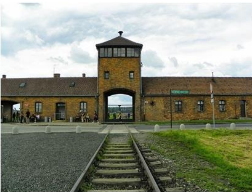
Kuva 2. Rankempaa ja synkempää turismia. Kuvassa Auschwitz II (Birkenau) pääsisäänkäynti.

Kohteet voivatkin paikallisesti ja ajallisesti vaihdella aina antiikin ajan aikaisista teloituspaiikoista 2000-luvun terrori-iskujen paikkoihin. Tänä päivänä ehdottomasti tunnetuin ja myös suosituin synkkään turismiin liittyvä paikka on natsi-Saksan perustama Auschwitz-Birkenaun keskitysleiri, jossa natsit järjestelmällisesti tappoivat miljoonia juutalaisia ja myös muita vähemmistöjä toisen maailmansodan aikana. Nykyään paikka toimii museona, jossa on mahdollista kiertää keskitysleirin aluetta ja oppia sen historiasta.