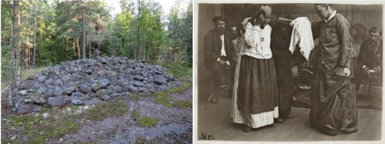
Kuva 1. Läntisen Suomen kuolemankulttuuria ovat esimerkiksi Kiukaisten kulttuuriin ja pronssikauden kulttuuriin liittyvät hautaröykkiöt, hiidenkiukaat (vasen kuva). Itäiseen kulttuuriin kuuluvat esimerkiksi karjalaiset itkuvirret ja niitä esittävät itkijänaiset (oikea kuva)