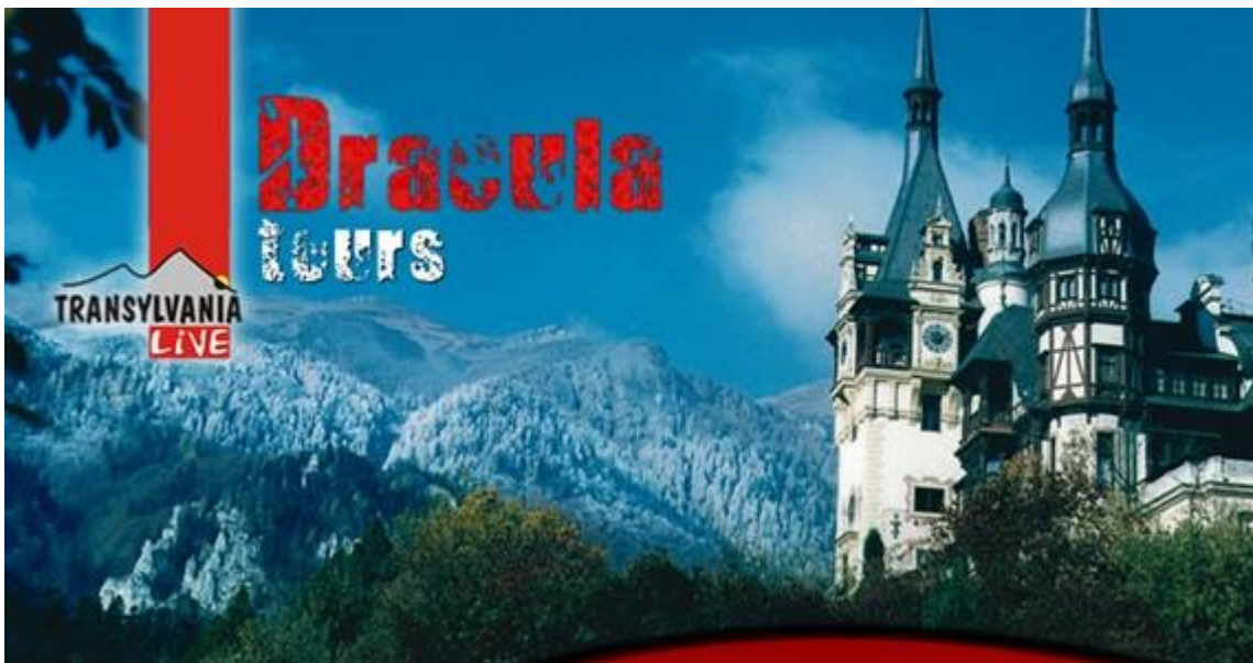
Kuva 3. Viihteellistettyä ja kevennettyä synkkää turismia tarjoavat erilaiset Dracula-turistikierrokset Romaniassa.