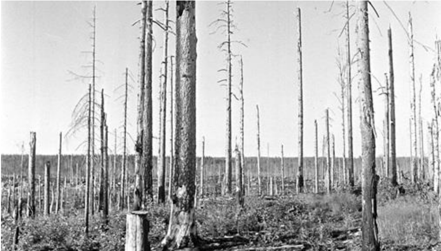
Kuva 6. Tuhoutunut Kollaa jatkosodassa.

Laakkonen otti luennollaan esiin myös eläinten näkökulmaa. Sodan aikana luonnoneläimiä, kuten hirviä ja peuroja, metsästettiin valtavat määrät. Metsästystä haluttiin rajoittaa, mutta Laakkonen huomautti osuvasti, että ”mahtoiko moisilla rauhanajalta otetuilta säännöksillä olla vaikutusta sota-aikana?” Sotilailla ei kuitenkaan koskaan ollut liikaa ruokaa saatavilla. Aseiden käyttö oli myös jokapäiväistä, mikä vaikutti metsästyksen yleisyyteen sodassa. Metsästyksen tapauksessa voidaan myös ironisesti pohtia ihmisen roolia: miksi eläinten metsästystä on oikeus rajoittaa sodassa muutamaankuukauteen, mutta toisen ihmisen tappaminen on sallittua vuoden ympäri?