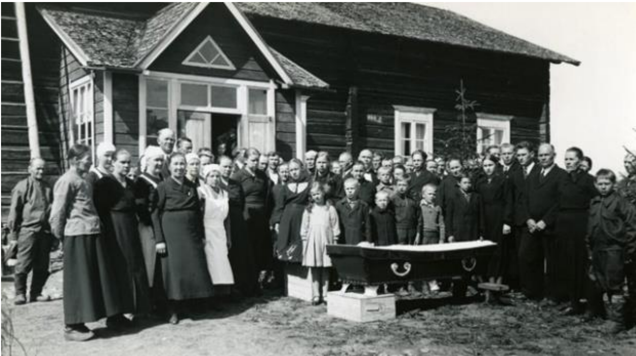
Kuva 4. Vielä 1900-luvun alussa Suomessa oli yleisenä tapana hautajaisissa ottaa kuvia vieraista avoimen ruumisarkun ympärillä.